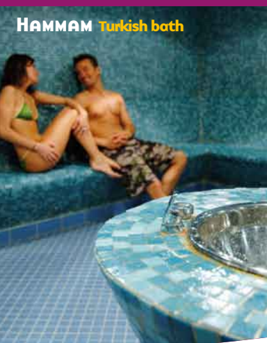
HAMMAM Turkish both